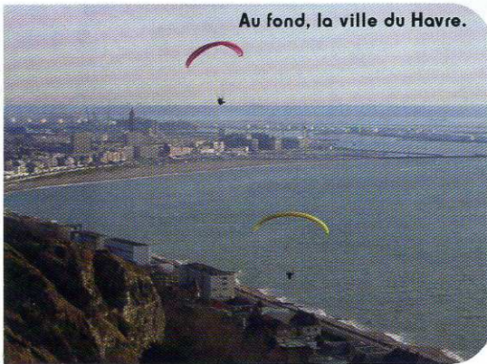
Au fond, la ville du Havre.

plus pour le speed). Si c'est petit, il vaut mieux vite poser en haut tant que c'est faisable, car si l'on passe sous le niveau de la falaise, c'est la descente assurée. On peut alors survoler les maisons avant de rejoindre le carré de pelouse au-dessous du déco, mais il vaut mieux perdre son altitude au-dessus de la plage de galets. Les intervalles de galets sont posables en dernier recours à marée basse mais il faut être précis.